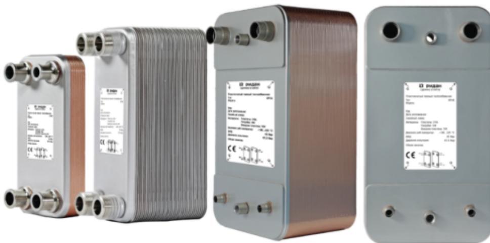
Рис.1 - Внешний вид теплообменников пластинчатых типа ВРНЕ

Теплообменники пластинчатые типа ВРНЕ предназначены для передачи тепловой энергии от одного теплоносителя к другому. Теплообменники пластинчатые типа ВРНЕ могут применяться в холодильных установках (компрессорных, абсорбционных), а также в тепловых насосах. В качестве рабочих сред могут использоваться негорючие хладагенты (фторуглероды, хлорфторуглероды, аммиак, СО 2 ), технические и холодильные масла, вода для технических нужд и систем ГВС, спиртосодержащие растворы.